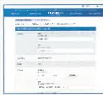
お客様情報の 入力画面