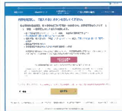
ご加入内容確認画面