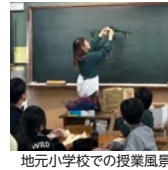
地元小学校での授業風景

その活動の一環で、小学校からの依頼を受け、子どもたちに端材を使って自由に工作をしてもらう授業を行うようになり現在では、地元宇治市だけでなく、京都市、長岡京市、井手町などでも活動を行っています。この活動をされている理由をお聞きしたところ「実際に木を使って物を作ることで、子どもたちには創造力や楽しさを広げてほしいと思っています。自分で作り上げた作品が自信となり、物や生命の大切さに気づいてくれることを願っています。また、職人さんという素晴らしい職業の存在を知ってもらい、その技術に触れてもらいたいと考えています。子どもたちの笑顔を届けるために、この活動を続けています。」とおっしゃられていました。今後は、地域に必要とされる企業として、他の地域企業とも協力して様々な取り組みを行っていきたくと話されていました。