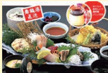
大人気! めっちゃおいしいプリン付 ※イメージ